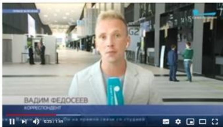
В Петербурге обсуждают интеграцию России в международную систему транзита