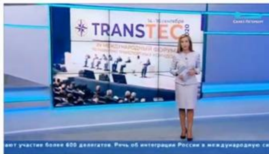
В Петербурге обсуждают интеграцию России в международную систему транзита